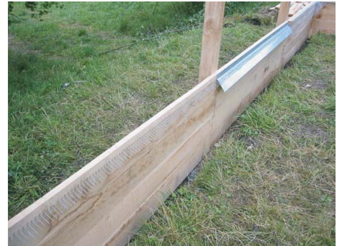
Nagelreihe und Lochblech des Schneckenzauns

An den Seiten des Gartens sind verschiedene Zaunabschnitte aus den letzten zwei Jahrhunderten nachgebildet. Das älteste Modell hat eine Reihe von Nägeln am Ende des Bretts, durch welche das Haus der Schnecke nicht hindurch passt. Die anderen Modelle bilden eine “Sackgasse” aus Blech oder “Hasengitter”, welches hier im Lautertal auch als “Schneckendraht” bekannt ist. Das neueste Zaunmodell ist ein Kunststoffzaun, wie er in den heutigen Freilandschneckenanlagen verwendet wird.